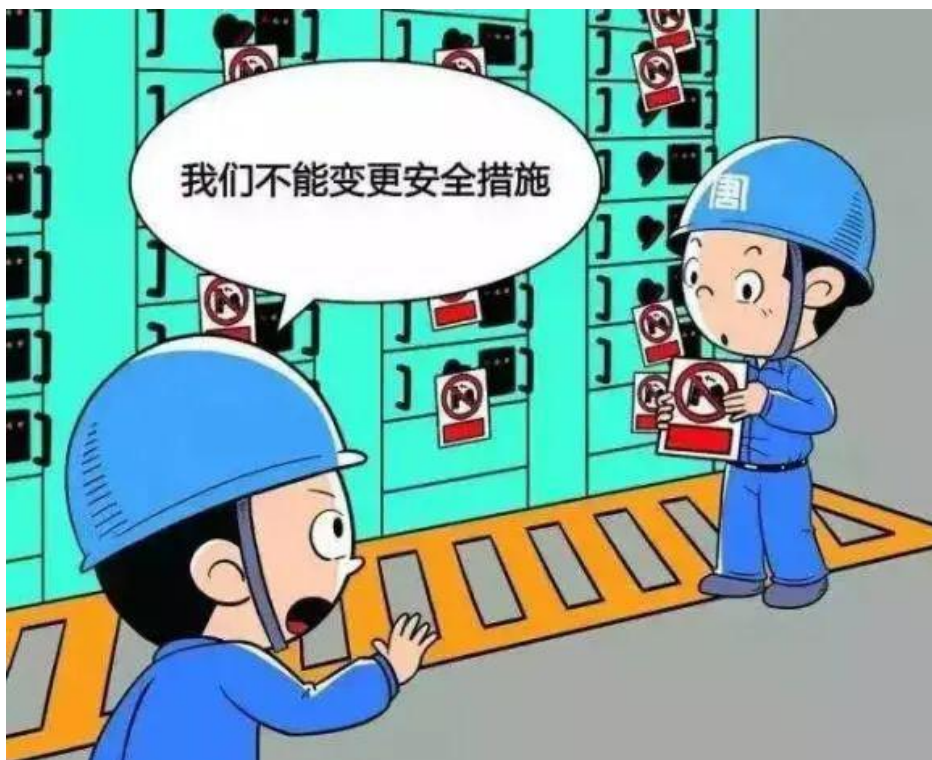
▲ 严禁擅自变更检修安全措施