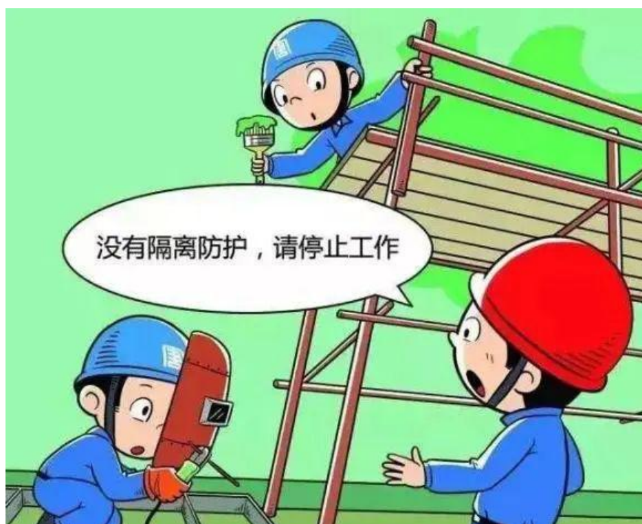
▲ 严禁交叉作业无防护隔离措施