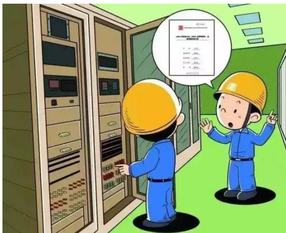
▲ 严禁无措施、方案进行重大操作