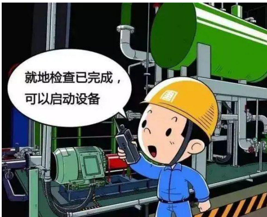
▲ 严禁未经检查、预警启动设备