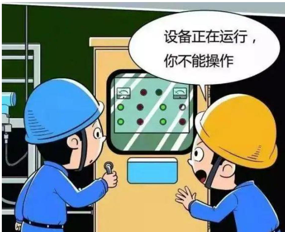
▲ 严禁非运行人员操作运行设备