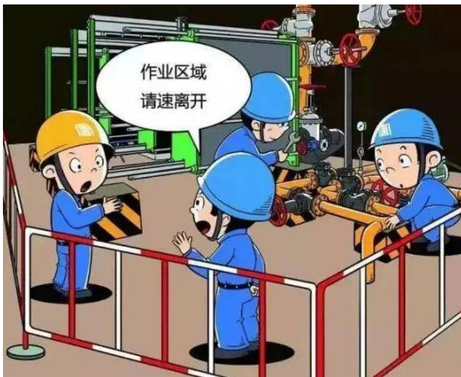
▲ 严禁非工作班成员在危险作业区域逗留