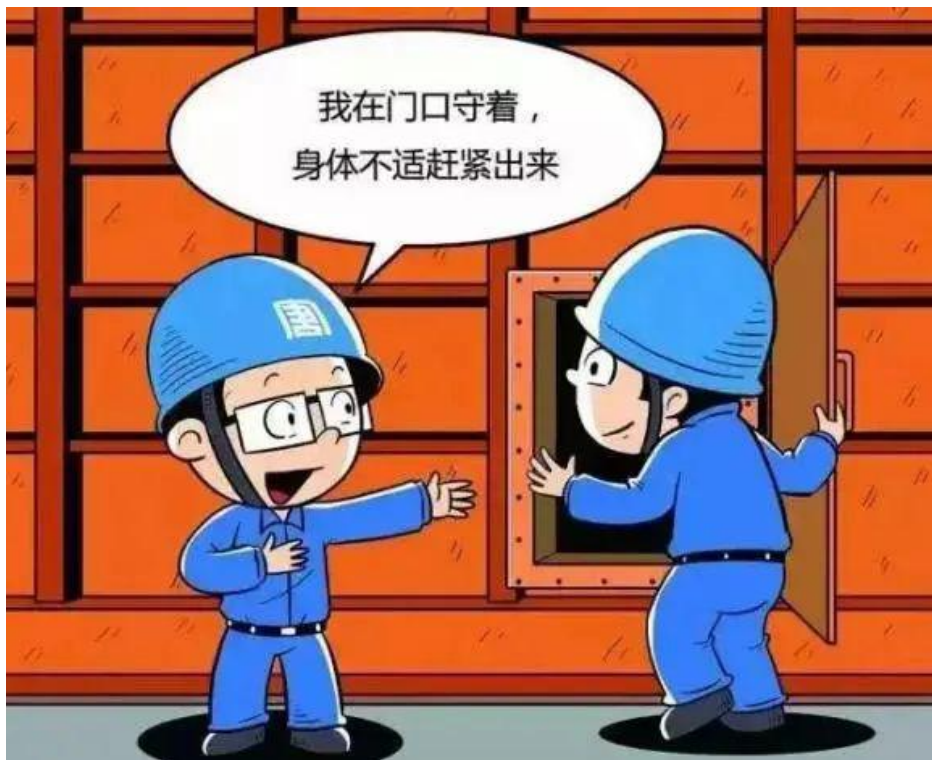
▲ 严禁封闭空间作业无人监护