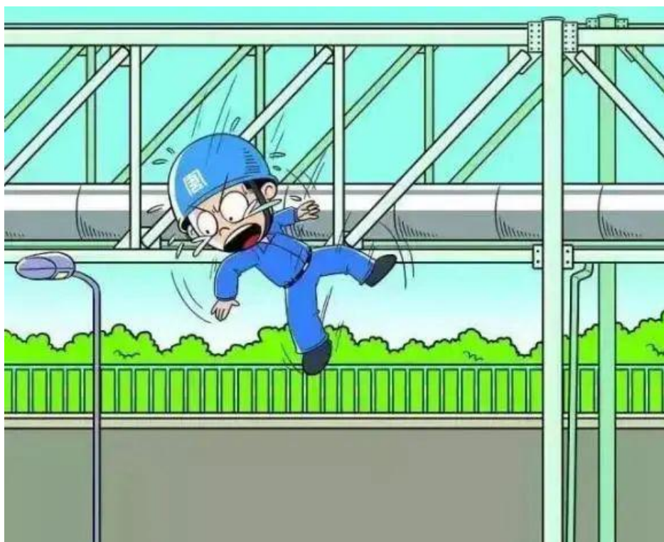
▲ 严禁高处作业不按规定使用安全带、安全绳、安全网