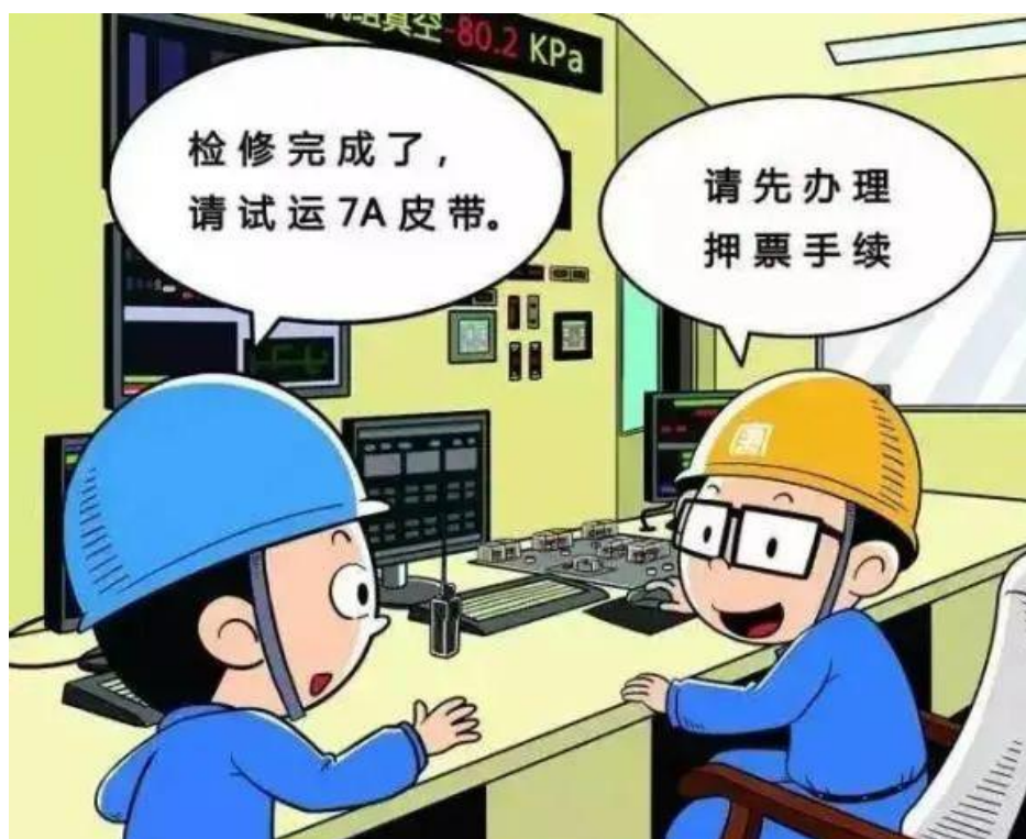
▲ 严禁未履行押票手续试运设备