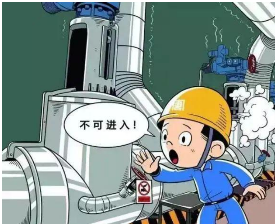
▲ 严禁进入状态不明的危险区域