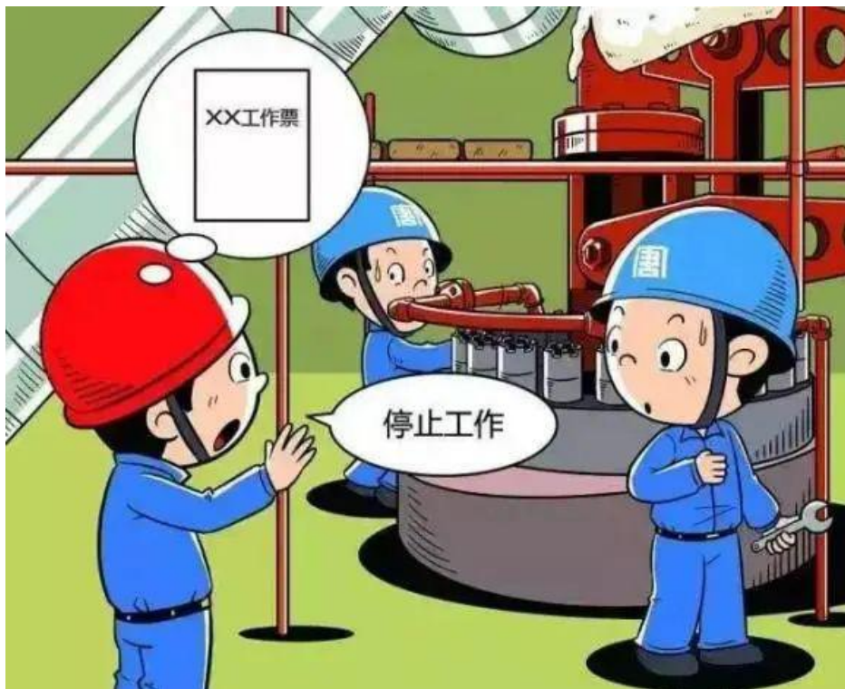
▲ 检修人员红线：禁无票作业