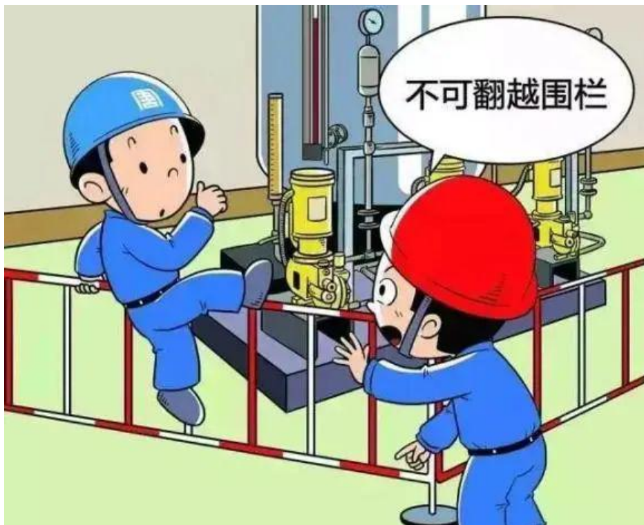
▲ 严禁擅自拆除、翻越检修围栏