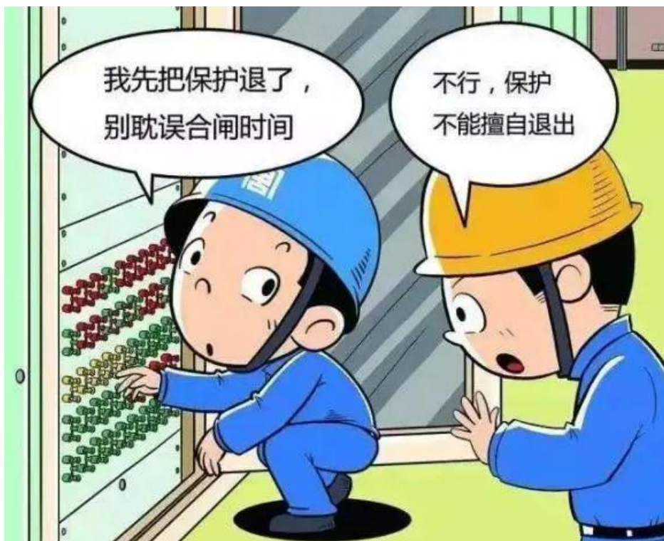
▲ 严禁未经审批擅自退出热控、电气保护