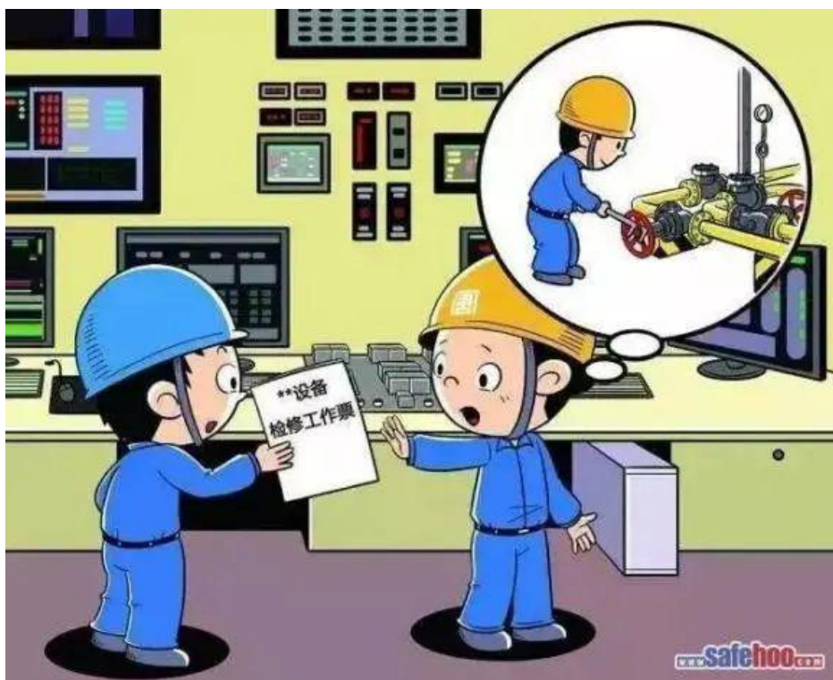
▲ 严禁安全措施未执行完毕发出工作票