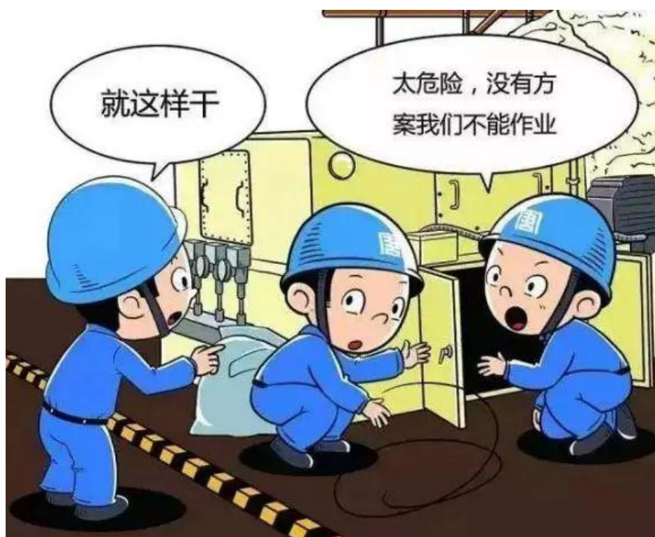
▲ 严禁无措施、方案组织危险作业