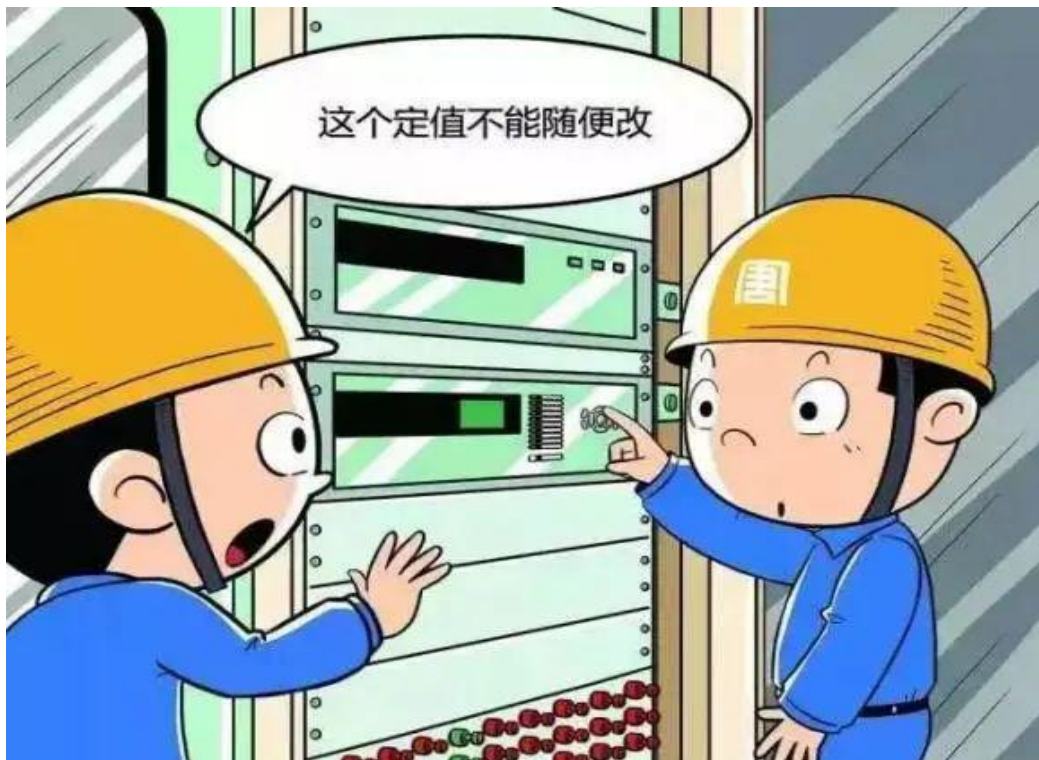
▲ 设备管理人员红线：严禁未经审批擅自修改逻辑及保护定值