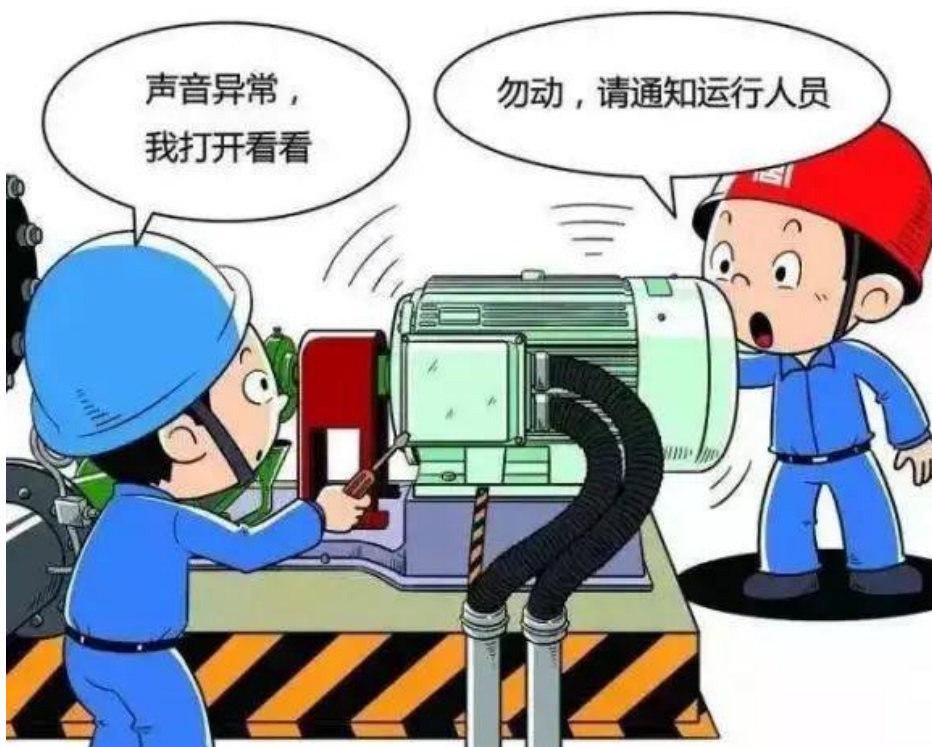
▲ 严禁擅自操作运行设备