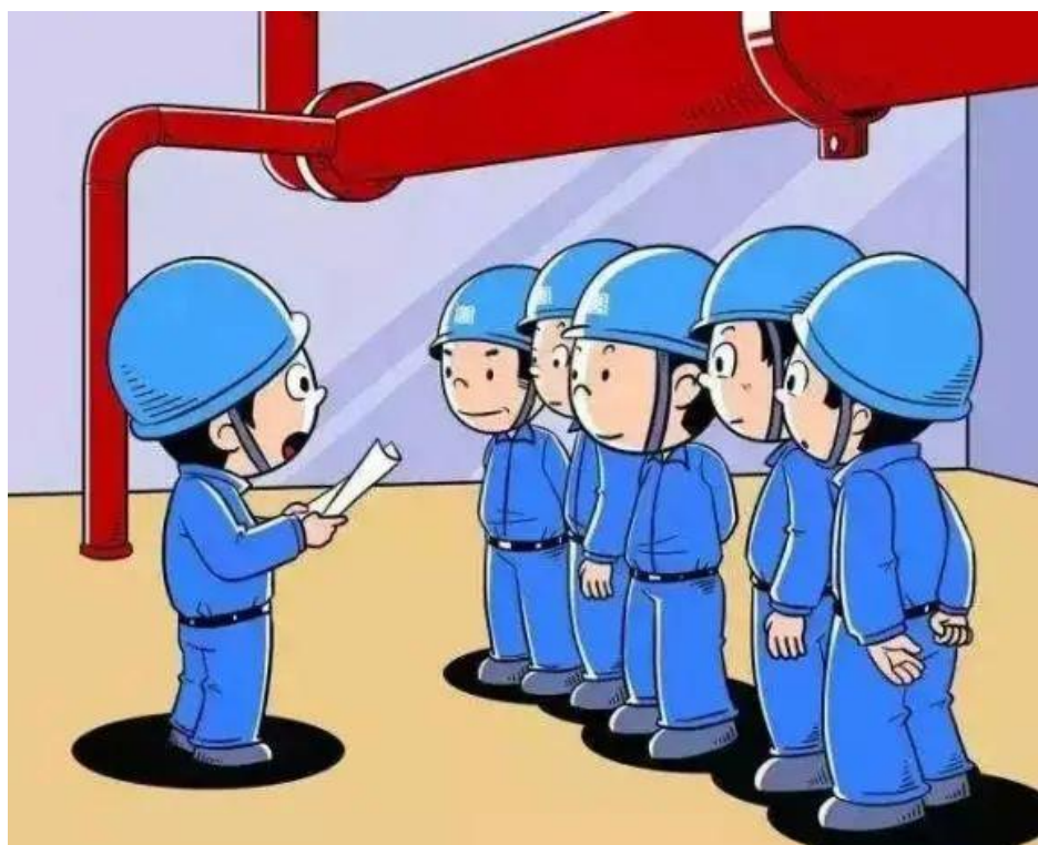
▲ 严禁无安全交底开展检修工作