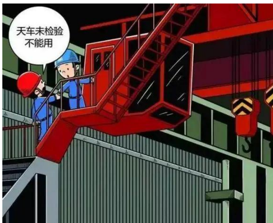
▲ 严禁使用无检验标签的起重设备