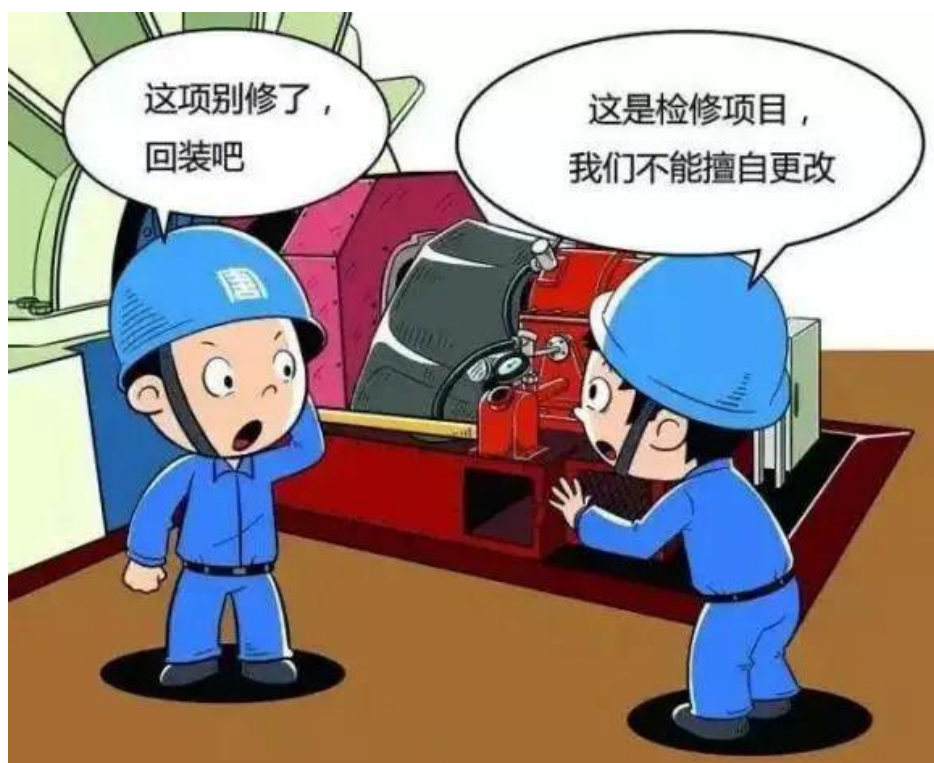
▲ 严禁擅自变更计划检修项目