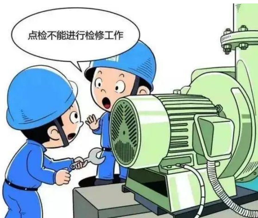
▲ 严禁点检人员进行现场检修工作