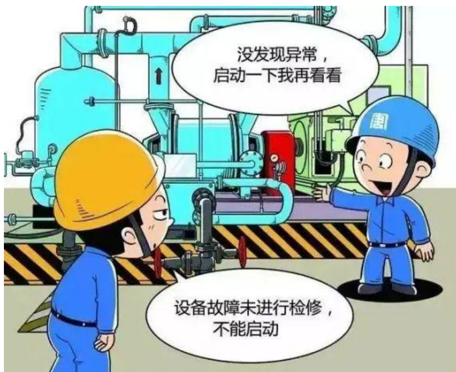
▲ 严禁未经允许以试代修