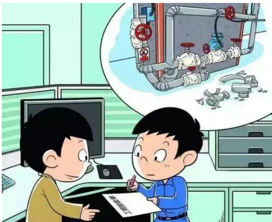
▲ 严禁检修项目验收缺位