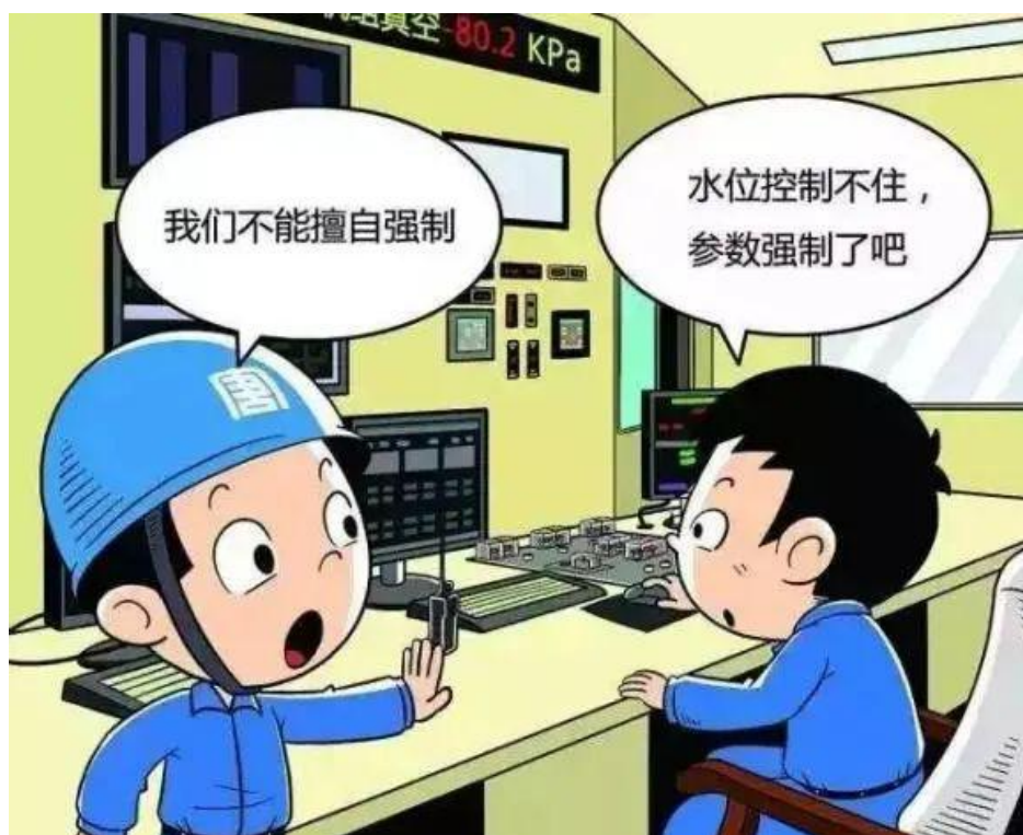
▲ 严禁未经审批强制运行参数